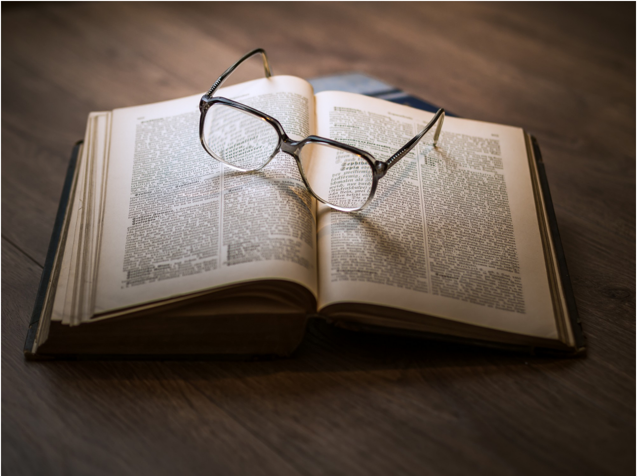
Illustration 9: De nombreux livres autour de la lithothérapie ont été écrits ces dernières années

Si vous voulez aller plus loin avec la lithothérapie et en apprendre plus, nous vous conseillons de vous orienter vers les livres suivants (vous pouvez trouver le livre en ligne en cliquant sur son nom) :