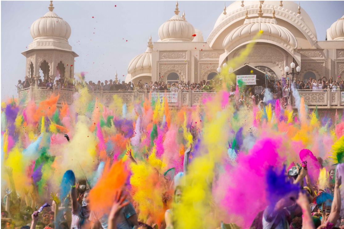
Illustration 6: Aujourd'hui encore, en Inde la couleur est partie intégrante de la spiritualité, comme ici avec la célèbre fête des couleurs

Ainsi, en nous basant sur la sagesse hindouiste, les guérisseurs égyptiens et les recherches des philosophes arabes puis européens, nous pouvons dresser le tableau récapitulatif suivant quant aux correspondances des effets et des couleurs :