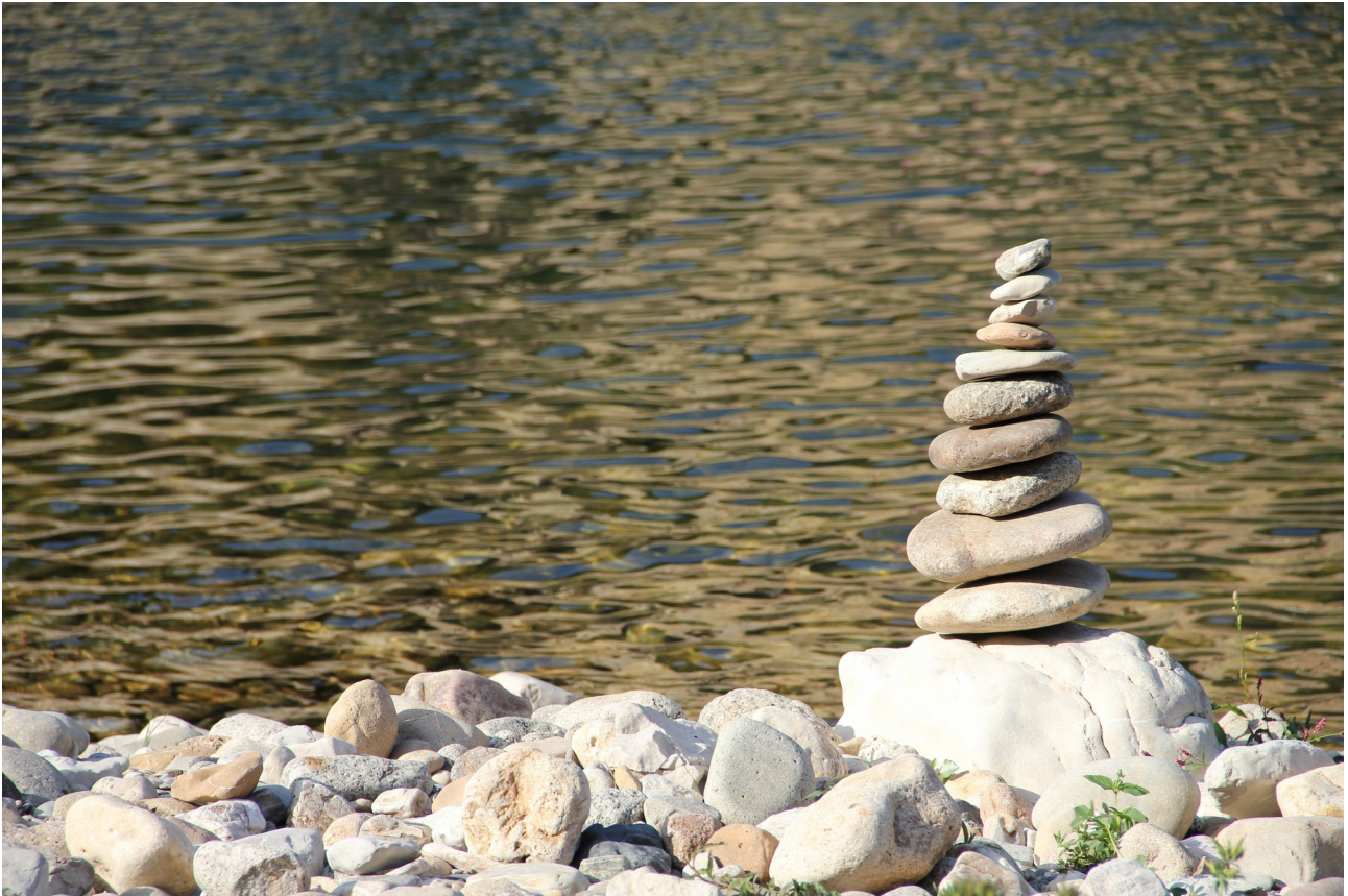
Illustration 7: L'eau et la pierre sont étroitement liées

Il vous suffit de laisser vos pierres tremper dans un bol d'eau pour leur permettre de décharger leur énergie négative dans l'eau.