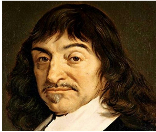
Illustration 4: Le grand philosophe des lumières, Descartes, qui est notamment à l'origine de la démarche scientifique et des méthodes mathématiques modernes avait bien compris que l'esprit et le corps formaient un tout

Cela fait bien longtemps que les médecines chinoises ou indiennes, et avant elles les civilisations Égyptienne et Aztèque, ont compris que l'esprit et le corps sont liés, et qu'un esprit troublé (c'est à dire une énergie, une vibration, troublée) entraîne des répercussions physiques.