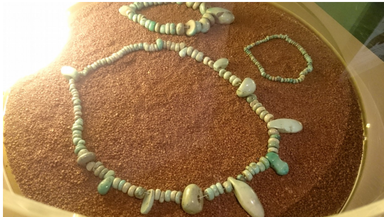
Illustration 1: Un collier pré-historique en Variscite , pierre d'harmonie et d'apaisement

Nos ancêtres ont très certainement ressenti avec une intensité inégalée cette force qui les liaient aux pierres, et c'est ainsi que l'on peut, dès la préhistoire, voir des pierres traitées comme des divinités et invoquées pour augmenter la force et la fécondité des porteurs. La lithothérapie, si elle n'est pas encore codifiée, est déjà née. 1