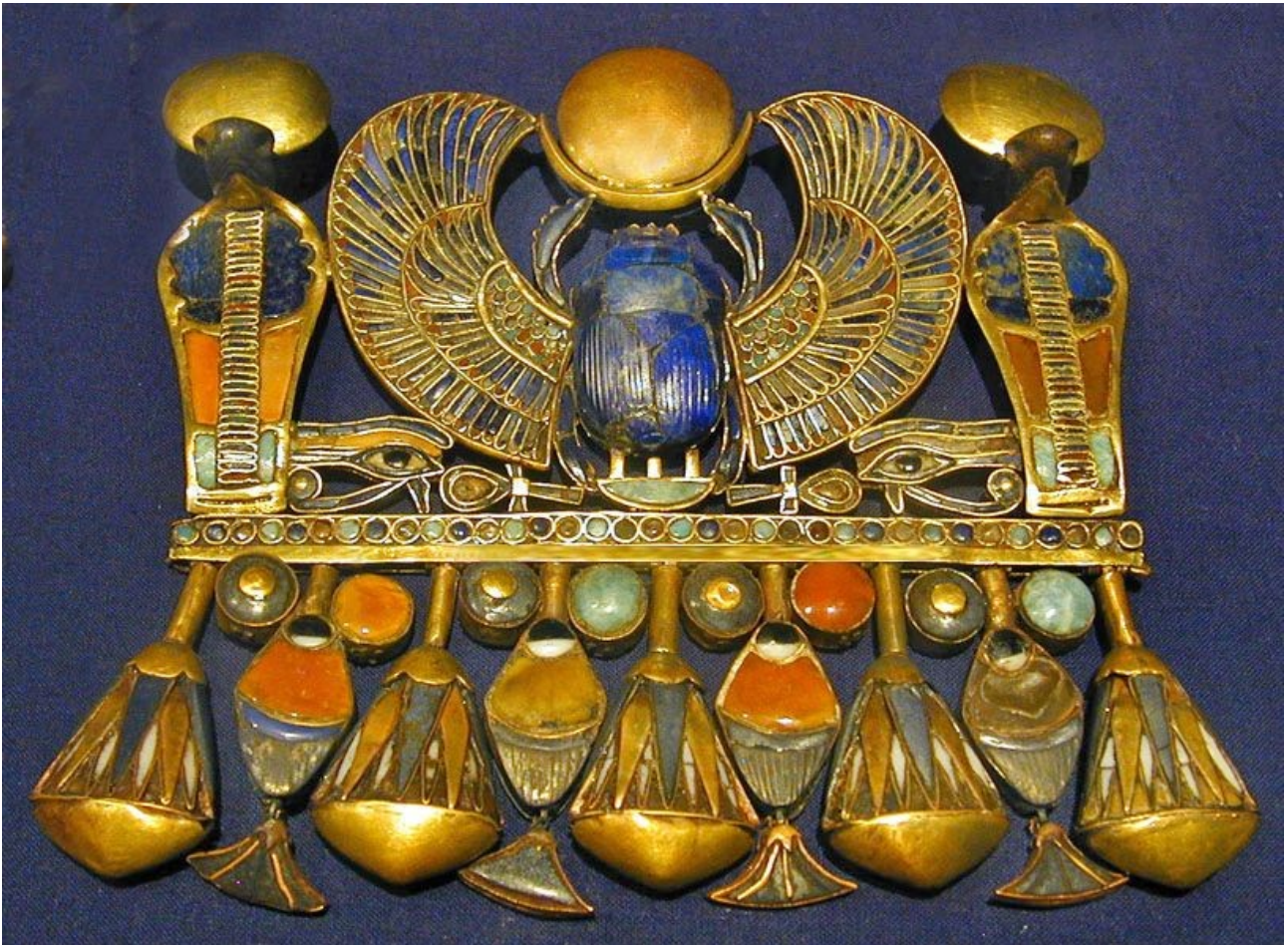
Illustration 2: On remarque comme les pierres de Lapis Lazuli portent les soleils, symbole du dieu Râ

En Égypte, c'est notamment le Lapis Lazuli , que les égyptiens associent alors à la spiritualité qui se retrouve sur les bijoux des grands pharaons.