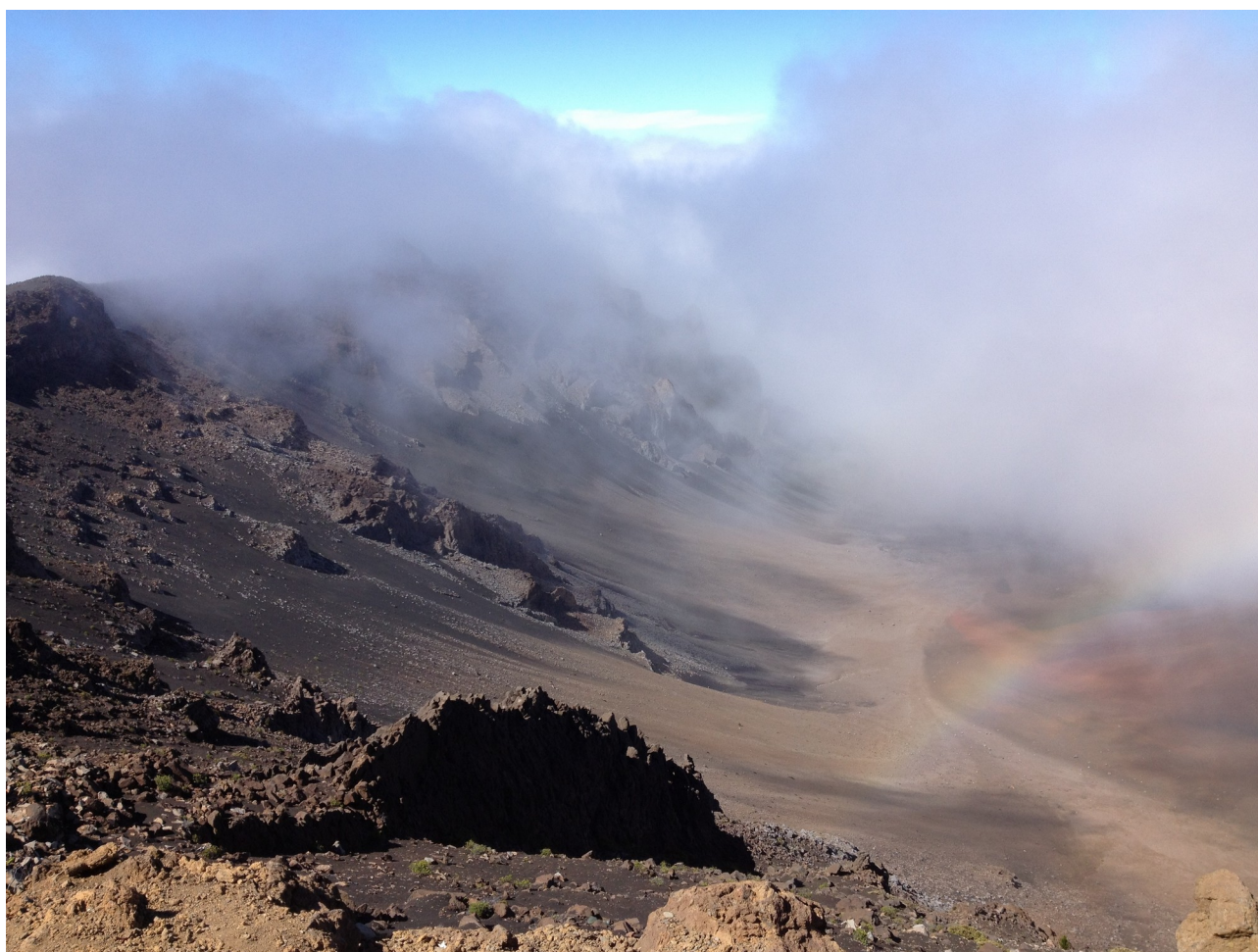
Illustration 8: Les pierres sont issues de la terre et s'y purifient et recharge puissamment

La purification par l'enfouissement est une opération un peu plus complexe et que vous devriez effectuer uniquement quand vous sentez qu'une pierre n'a plus d'effet, que la purification par l'eau n'est plus suffisamment efficace.